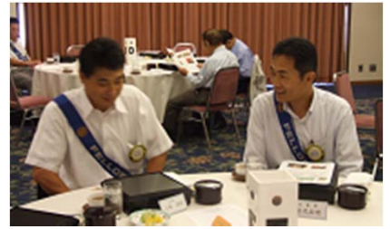
ホールインワン談義の花が咲く