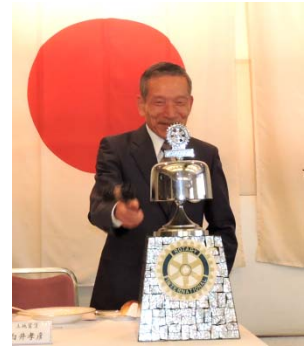
白井丸、帰港の点鐘