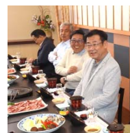
菊田会員・中道会員、写真をいつもありがとうございます。